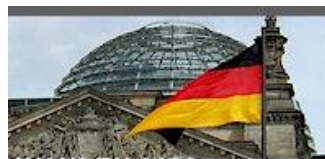
Politik aus der Hauptstadt